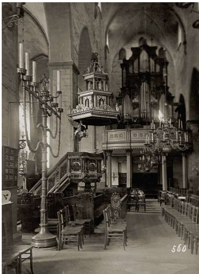
4. Tallinna Niguliste kiriku sisevaade läände (20. sajandi algus).