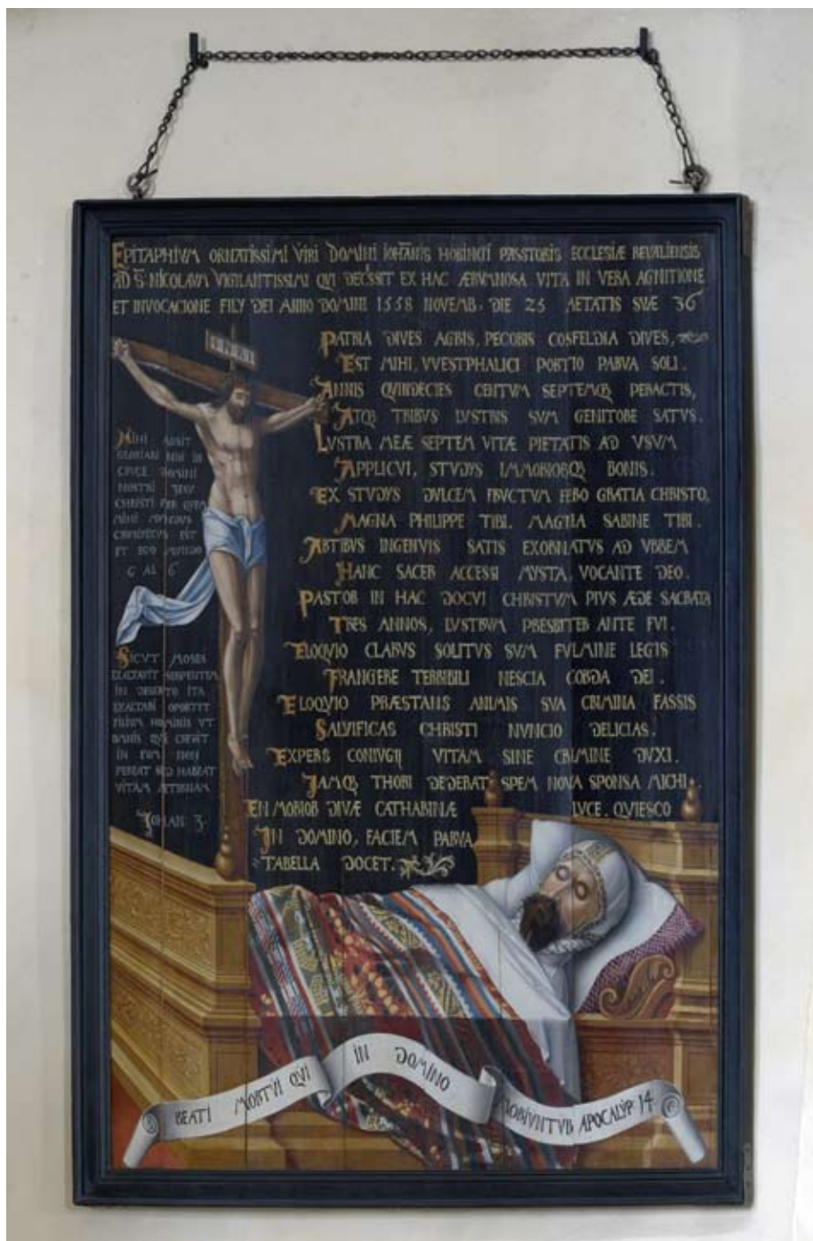
10. Tallinna Niguliste kiriku pastor Johann Hobingi epitaaf (1558). Eesti Kunstimuuseum, Niguliste muuseum. Foto Stanislav Stepaško, 2008. Epitaph for the pastor of St Nicholas' Church in Tallinn Johann Hobing (1558). Art Museum of Estonia, Niguliste Museum. Photo by Stanislav Stepaško, 2008.