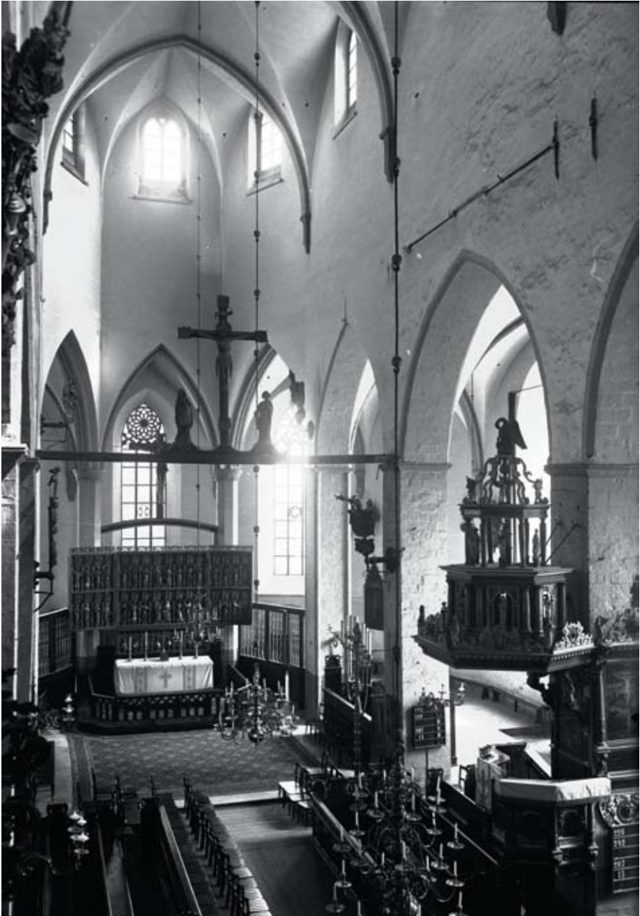
5. Tallinna Niguliste kiriku sisevaade itta (1939).

Interior view to the east, St Nicholas' Church in Tallinn (1939).