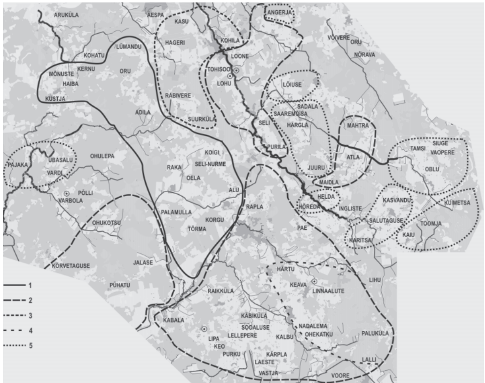
2. Harjumaa maavalduste jaotus 13. saj. keskel Graafika T. Mägi