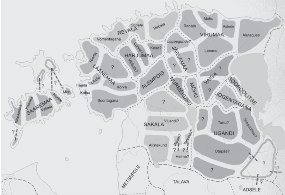
1. Muinas-Eesti maakonnad ja kihelkonnad 13. sajandi algul. Joonis Andres Adamson